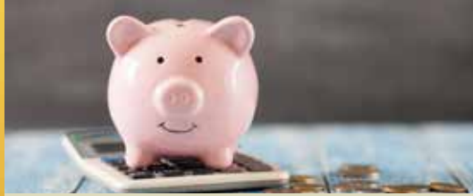
Wuustwezel helpt kwetsbare gezinnen in coronatijden (p. 2)