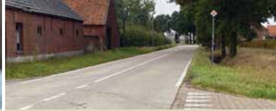
Werken fietspad Sint-Lenaartseweg gaan bijna van start (p. 5)