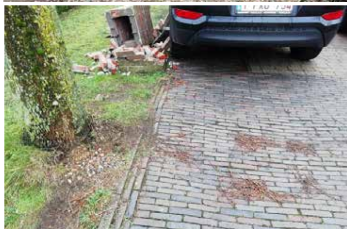
▲ Boomwortels veroorzaken schade aan opritten, maar het gemeentebestuur doet niets.