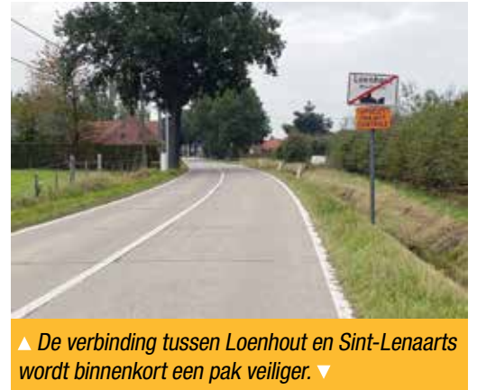
▲ De verbinding tussen Loenhout en Sint-Lenaarts wordt binnenkort een pak veiliger. ▼

Vanaf 2021 zullen de werken aan het fietspad effectief starten tussen de Sint-Annastraat en de brug in Loenhout. Concreet gaat het om een fietspad van 1,75 meter breed aan weerszijden van de weg, aangelegd in rode beton. Om de veiligheid van de fietsers te garanderen, wordt het fietspad achter de bestaande grachten aangelegd en zal er op bepaalde stukken een haag aangeplant worden. “We doorlopen nu de laatste stappen in de vergunningsprocedure”, zegt Gagelmans. “Het is het laatste ontbrekende fietspad met buurgemeente Sint-Lenaarts, maar wel een zeer belangrijke verbindingsweg. Eindelijk is er perspectief en kunnen we stilaan beginnen dromen van een fietstocht langs deze weg.”