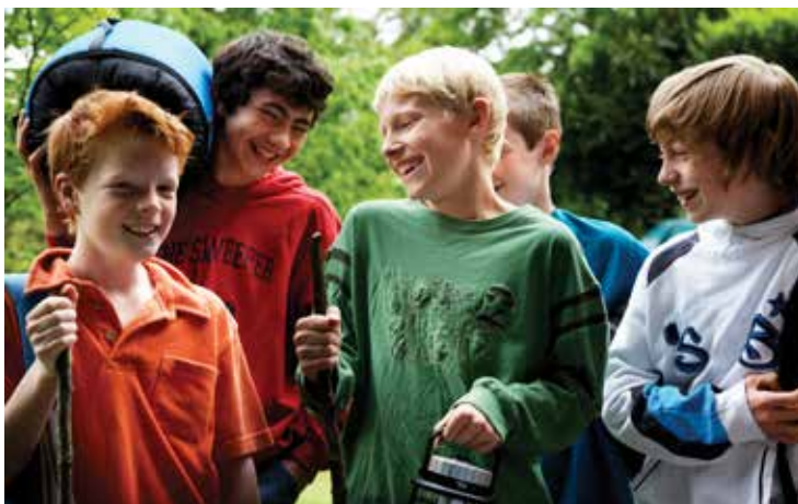
▲ Onder meer onze jeugdverenigingen krijgen een mooi bedrag.

Om de verenigingen uit de nood te helpen en ze zo min mogelijk extra werk te bezorgen, besliste de gemeenteraad om zowel de Vlaamse subsidies als het voorziene gemeentelijke budget te verdelen. Er wordt een gemiddelde berekend van de subsidies van de afgelopen drie jaar.