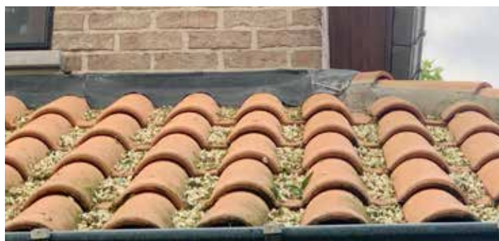
▲ Dakgoten raken verstopt door honingbomen.